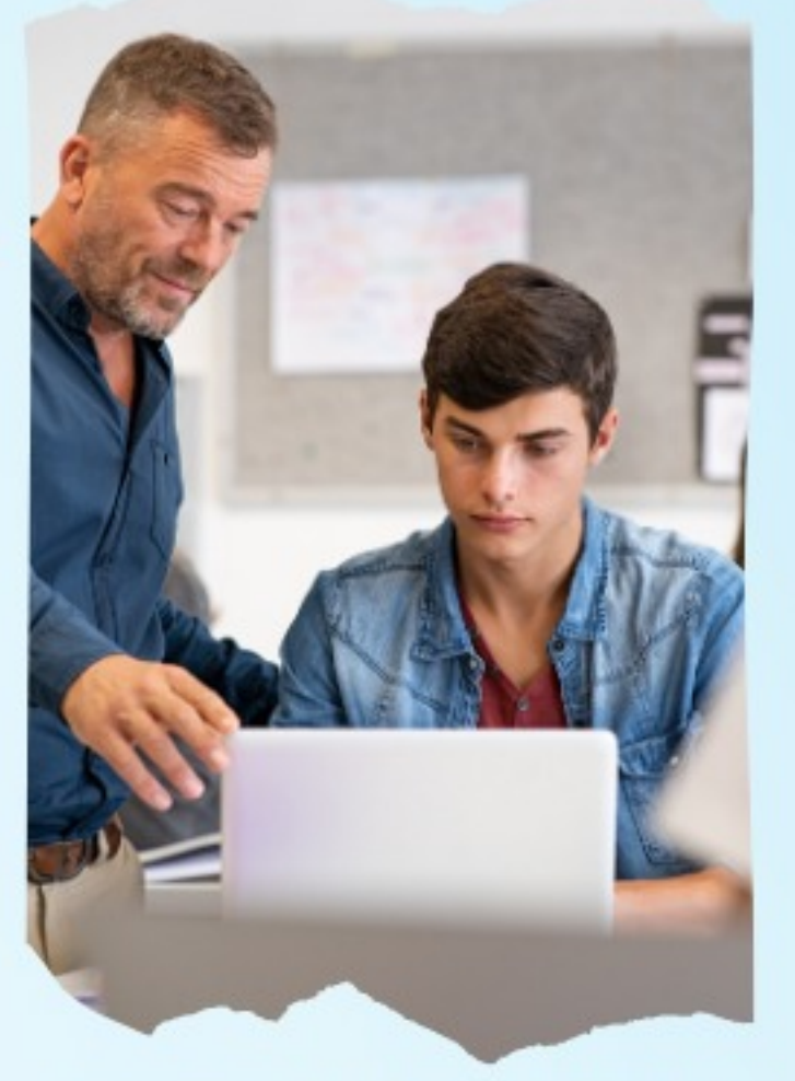
PRECIOS DE LOS CURSOS:

Grupos 6 110€ (mixto presencial inicio + online)